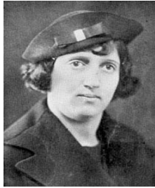
شهری از پروین اکتصاری